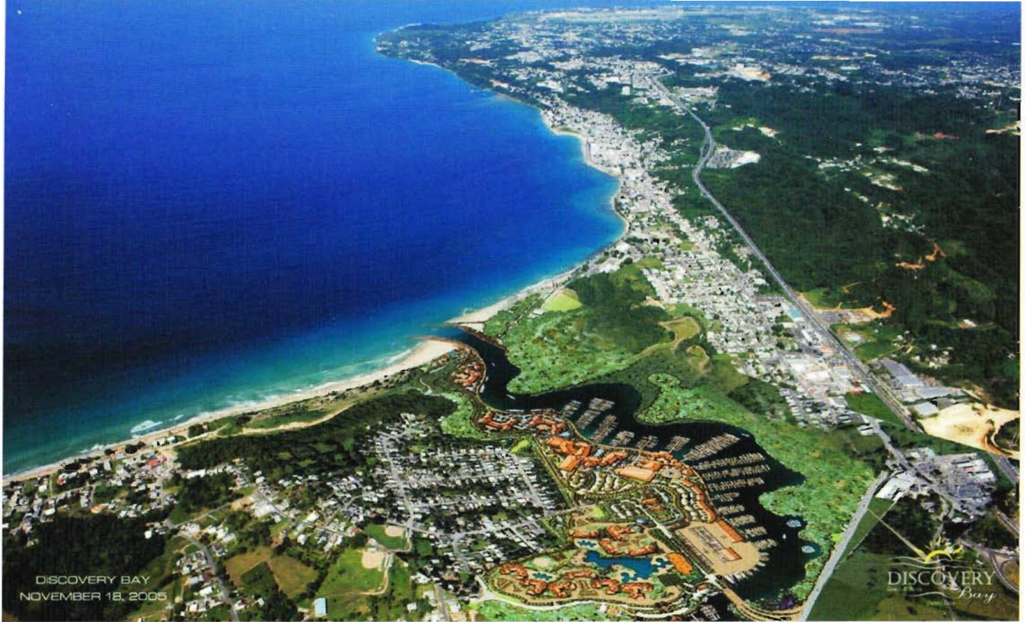
Futuro proyecto de Discovery Resort & Marina en Aguada.

mariposas están todos presentes en sus aguas cristalinas. Entre los peces más grandes encontramos varias especies de tiburones, manta rayas y morenas verdes. La visibilidad bajo el agua en isla de Mona es impresionante promediando de 60 a 80 pies. Es el sitio ideal para la fotografía submarina.